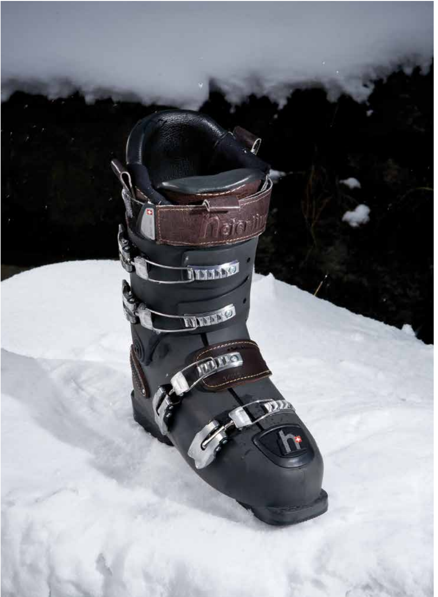
Echte Schweizer Qualität: Die Schaftteile des Innenschuhs sind aus echtem Rindsleder und werden, wie alle am Schuh befindlichen Lederteile, bei Gewerbetarnern in der Schweiz angefertigt. Hier abgebildet: Herren-Modell, h1, Komfort.