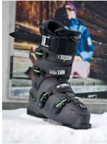
Basierend auf einer langjährigen Firmentradition sah sich die Forschungsabteilung von Heierling zu neuerlicher Höchstleistung angespornt. Seit 1883 produziert Heierling Skischuhe in Davos. Der neue h1 ist die jüngste Errungenschaft. Hier im Bild: Race-Modell, h1.

der Heierling AG ihren Höhepunkt. Mit 90'000 Paar Skischuhen, 160'000 Paar Langlaufschuhen und etwa 15'000 Paar Wander- und Freizeitschuhen. Nach knapp 20-jähriger Abstinenz in der Produktion von eigenen